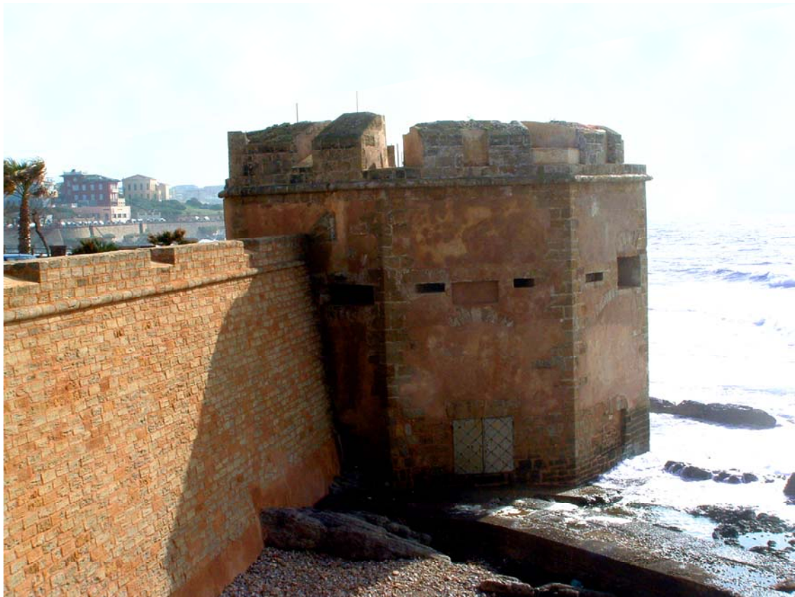
Alghero, Torre S. Giacomo